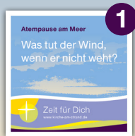
Was tut der Wind, wenn er nicht weht?